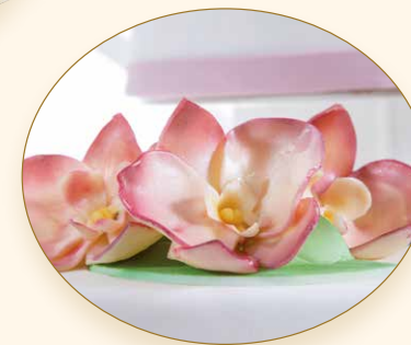
Blütenpracht · Cascata di fiori