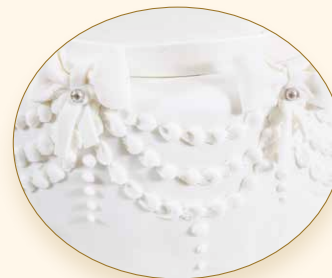
Perlenglück · Perle di felicità