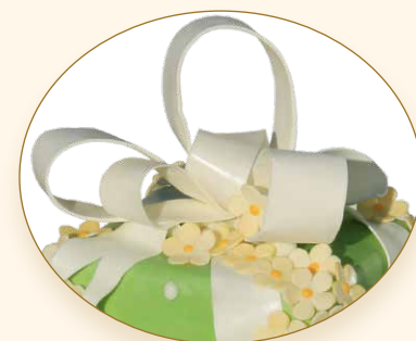
Blumenranke · Ramoscello fiorito