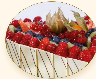
Früchteherz · Cuore di frutta