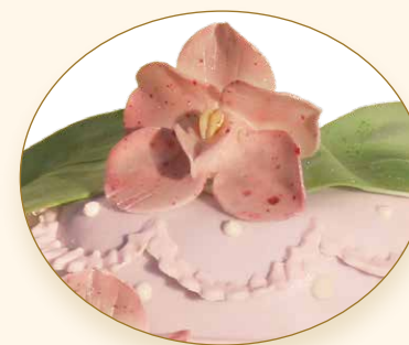
Orchideentraum · Sogno di orchidee