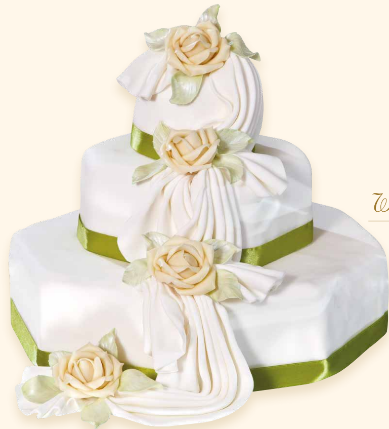
Weißer Rosen · Rose bianche