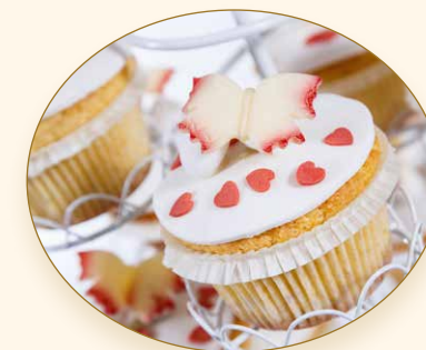
Muffinwunder · Muffin delle meraviglie