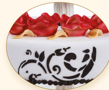
Rosenzauber · Magia di rose