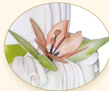
Hochzeitsblüte · Fiore della sposa