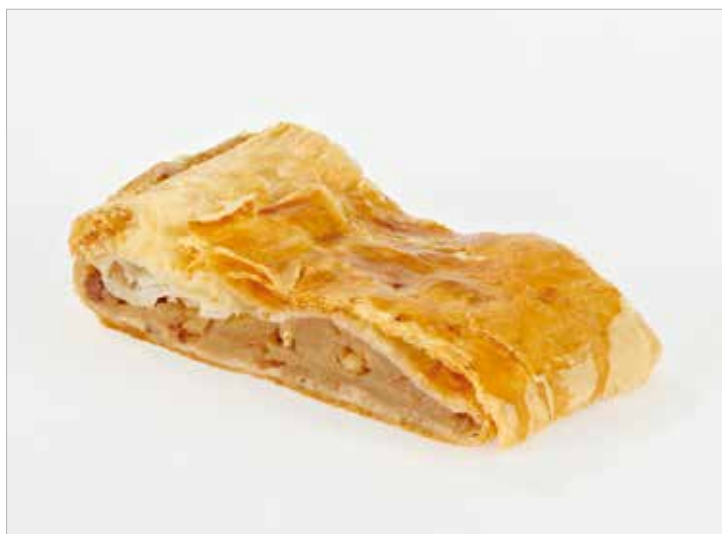
STRUDEL DI PASTA SFOGLIA