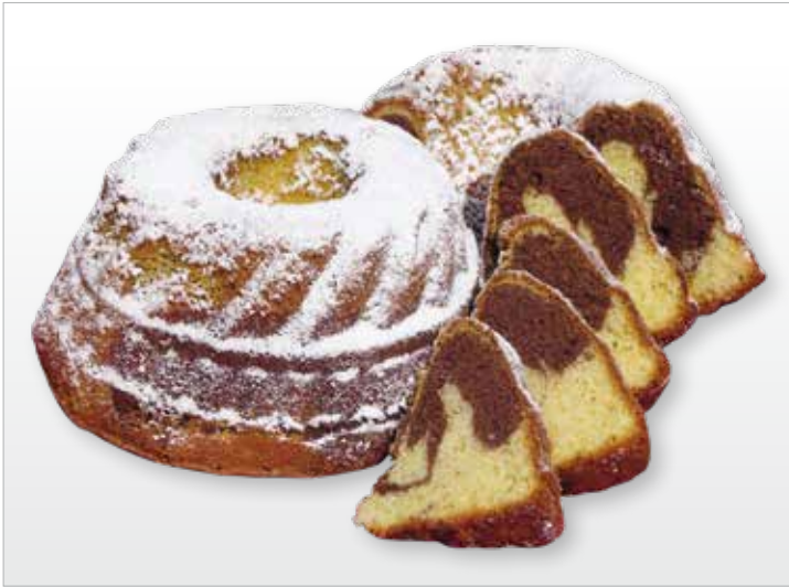
TORTA DI MARMO