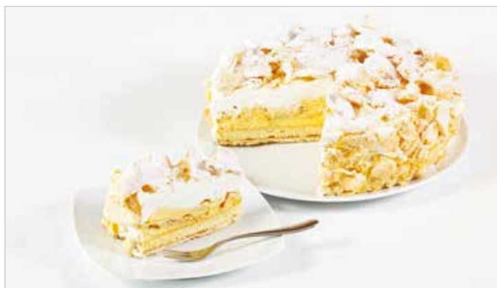
FIOCCHI DI PANNA