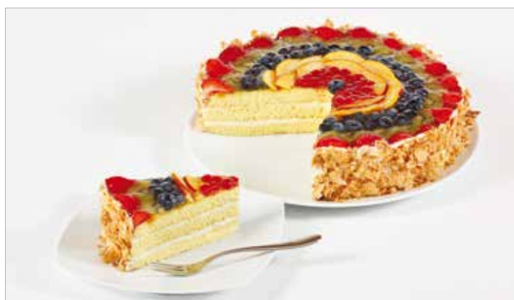
TORTA ALLA FRUTTA