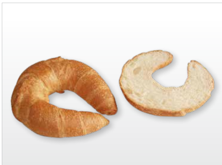
BRIOCHE DI PASTA SFOGLIA