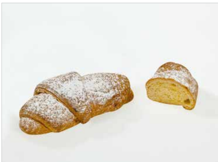
BRIOCHE ALLA CREMA