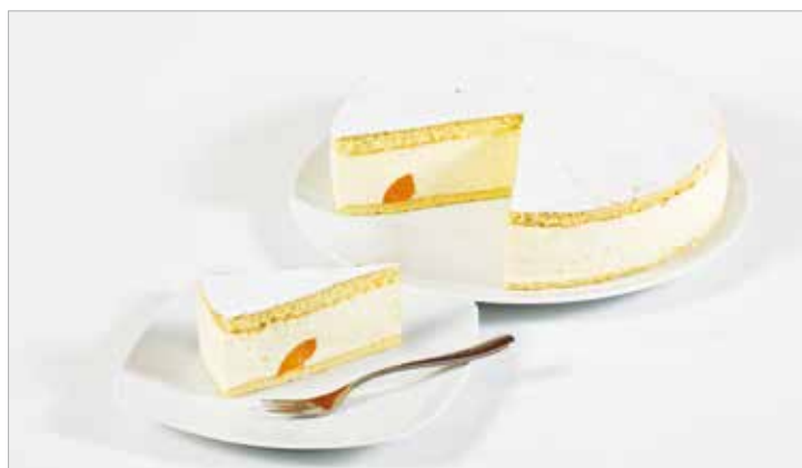
TORTA FORMAGGIO PANNA