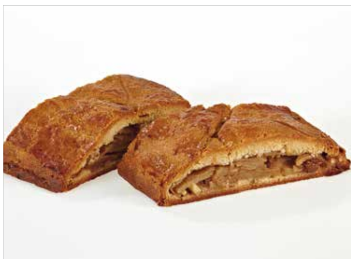
STRUDEL ALLA FARINA DI FARRO