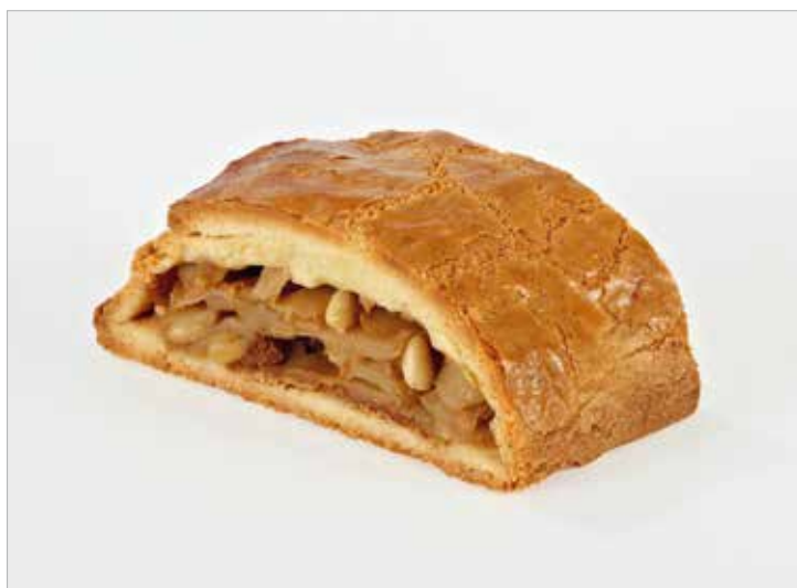
STRUDEL DI PASTA FROLLA