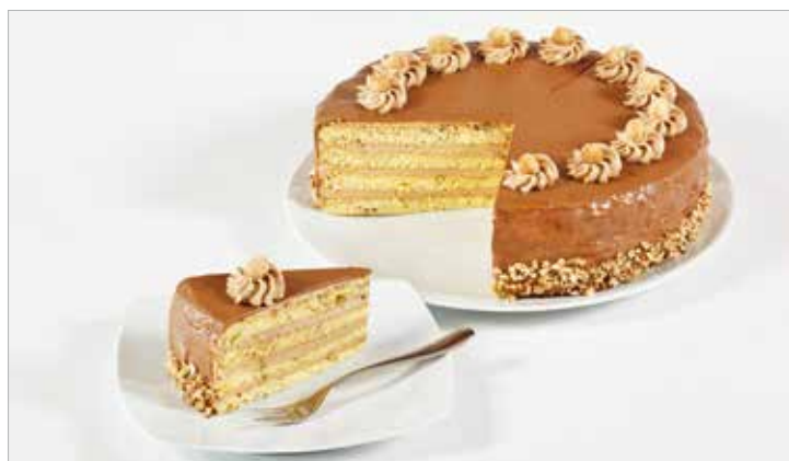
TORTA ALLE NOCCIOLE